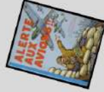
Manuel officiel élémentaire de Défense passive contre les attaques aériennes. Hachette, 1940. 32 pages / Réseau Canopé/Muraé

1940 : Les écoliers s'entraînent à la Défense passive depuis 1939. En 1940, un manuel officiel est publié.